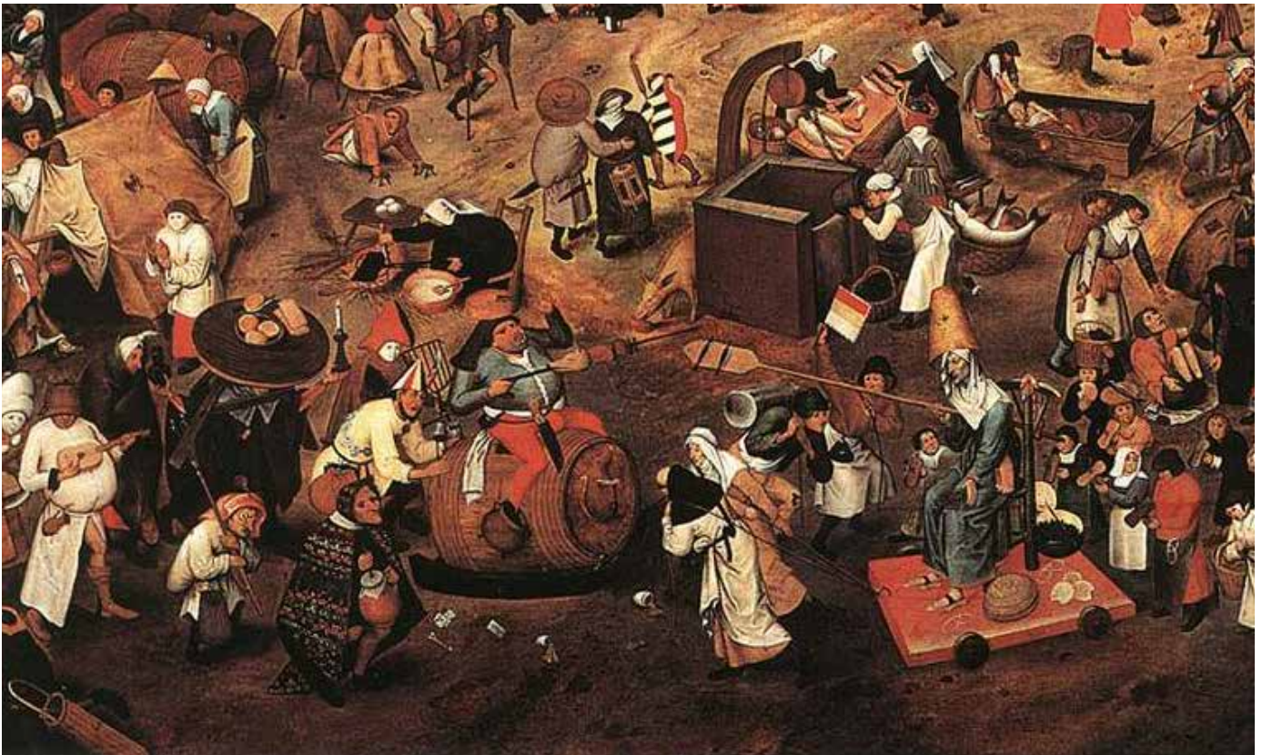
Peter Bruegel den Ældre – Kampen mellem fastelavn og faste (1500-tallet)