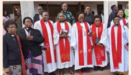
Præster i den lutherske kirke i Tanzania, som Danmission har arbejdet med i 75 år.

I begyndelsen af september var jeg med til en 75-års-fejring – en fejring af, at missionselskabet Danmission i 75 år har arbejdet i Tanzania. Nu til dags arbejder man sammen med den lutherske kirke dernede i et partnerskab, hvor vi stadig har meget at give af økonomiske ressourcer og viden, men hvor den tanzanianske lutherske kirke selv fortæller, hvad de har brug for vores hjælp til – og hvor de kan give os noget tilbage. Ved fejringen sang vi blandt andet "Nu takker alle Gud" (nr. 11 i salmebogen) på swahili – prøv selv: