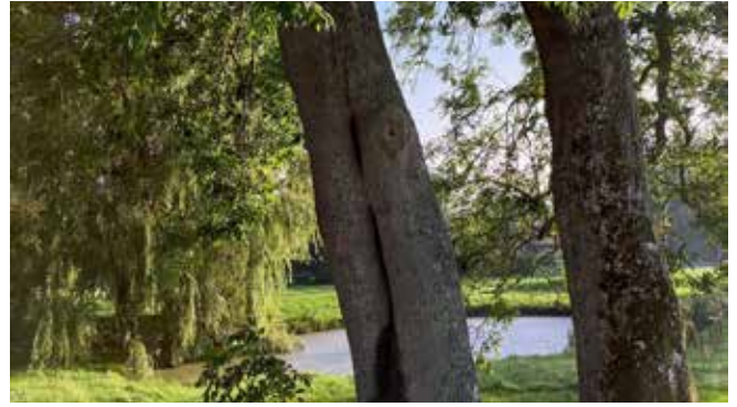
Der er flyttet en sværm honningbier ind i asketræet ved Nylars Kirke.