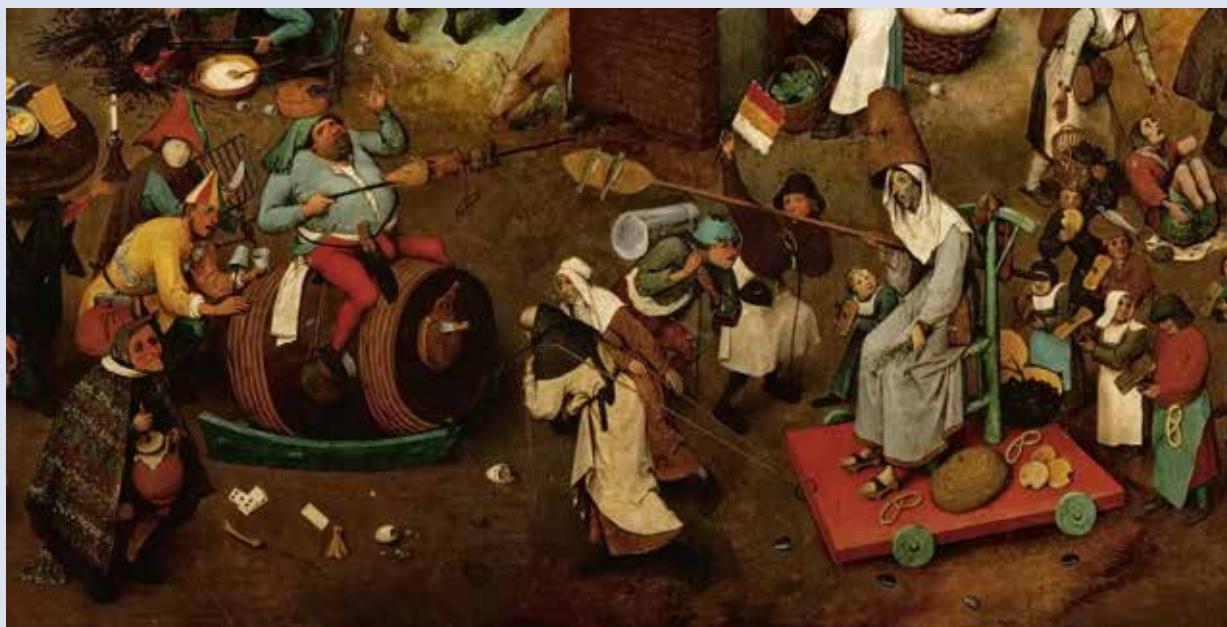
Pieter Brueghel den ældre: Kampen mellem fest og faste (1559)

Normalt plejer fasten først at begynde med fastelavn, der i år ligger midt i februar, lige om lidt. Men i år er det, som om den er begyndt lidt tidligere.