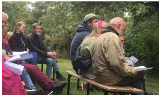
50 modige mennesker mødtes mellem to juli-byger til fri-luftsgudstjeneste i Arnager, godt ledsaget musikalsk af Folk og Fæ.

Kirkebil: Kirkebilen kører til alle gudstjenester og er gratis. Bilen skal helst bestilles dagen i forvejen på tlf.: 70 25 25 25. Husk at bestille en returvogn!