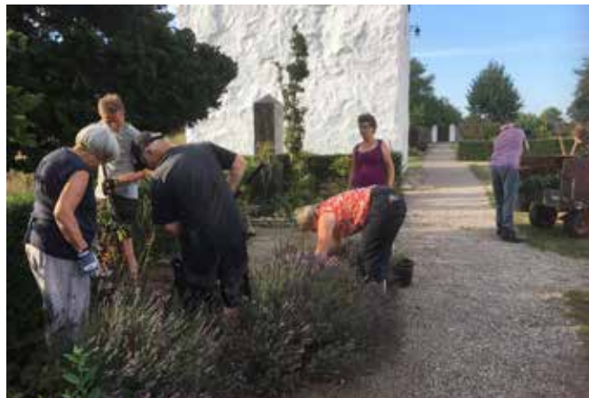
Også på Nylars Kirkegård var der en fælles arbejdsdag, hvor ukrudtet fik ben at gå på. Tak til alle, der mødte op!