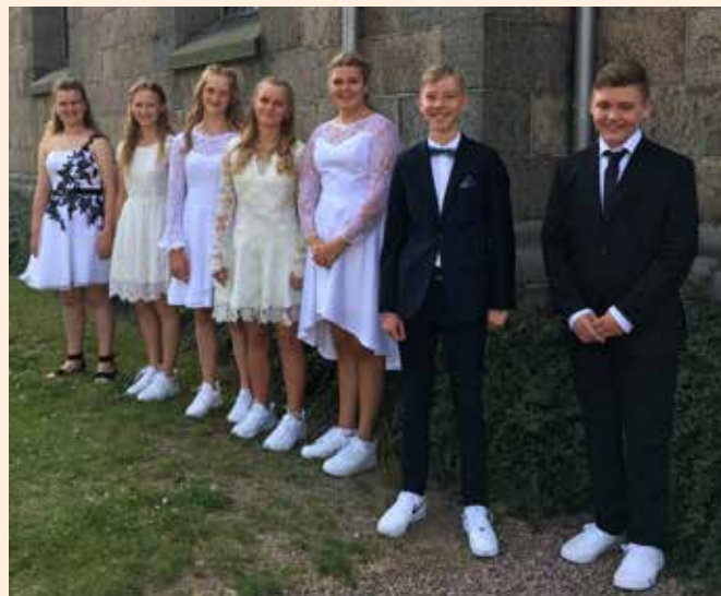
Den 8. august blev årets syv konfirmander endelig konfirmeret. Tillykke til dem alle!