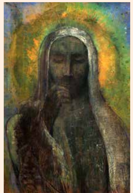
Odilon Redon 1897 "Le Christ du silence".

Men det allermest usynlige, og det, som måske er så dagligdags, at vi helt glemmer, at det hører til at være kirke, er det at besøge hinanden. Og ikke kun dem, der er særligt sjove eller søde – kirkens store, fælles opgave er at besøge hinanden, når vi er plaget af